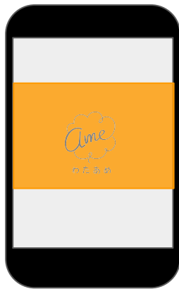
インター ステイシャル